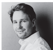
指揮 クレメンス・シュルト